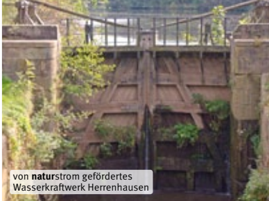
von naturstrom gefördertes Wasserkraftwerk Herrenhausen